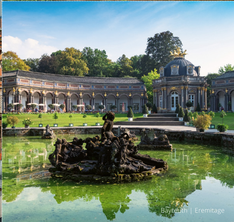
Bayreuth | Eremitage