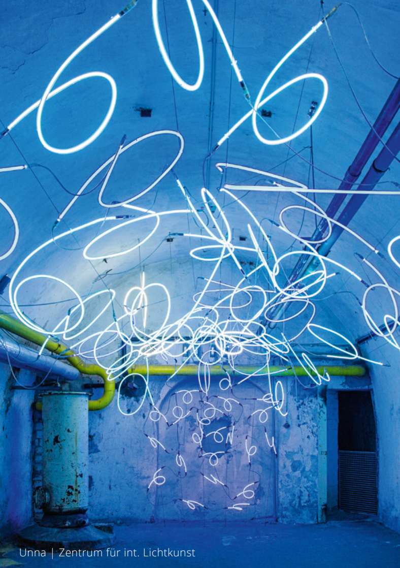
Unna | Zentrum für int. Lichtkunst