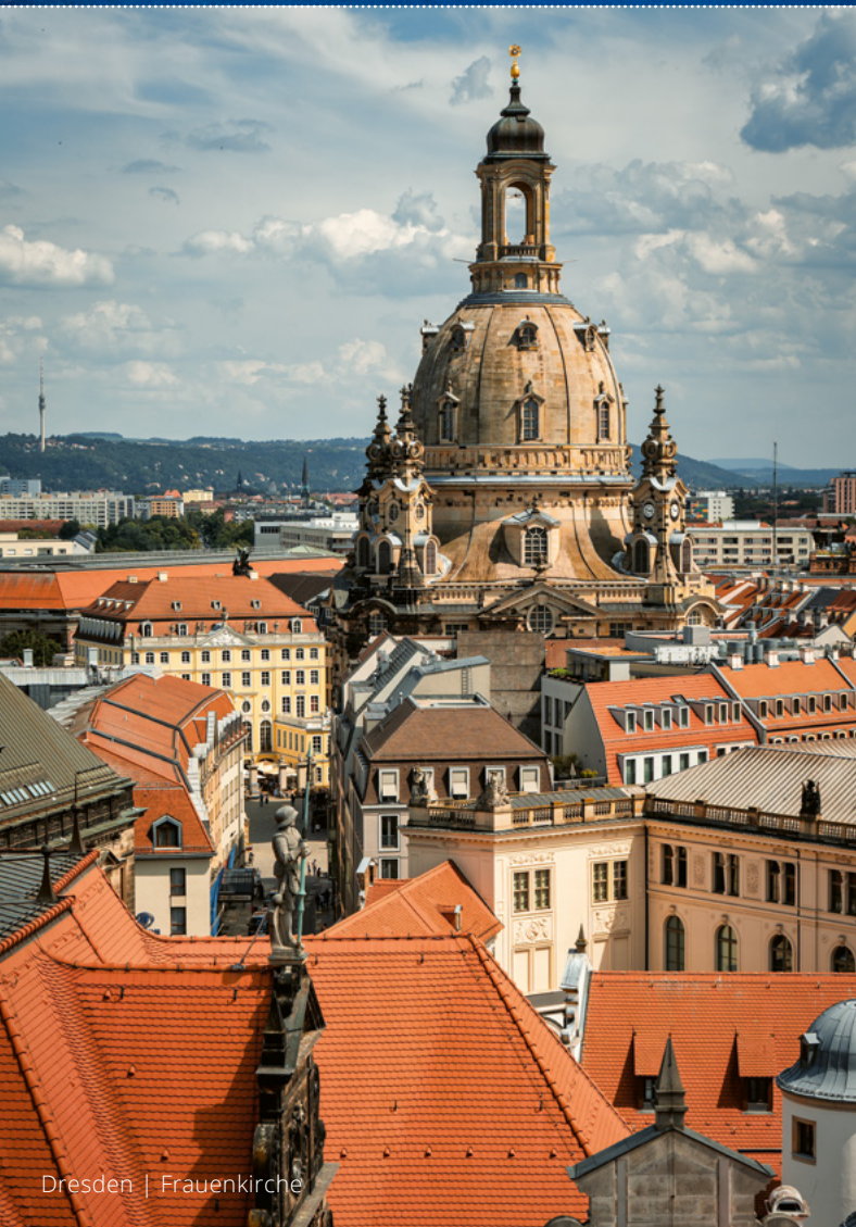
Dresden | Frauenkirche