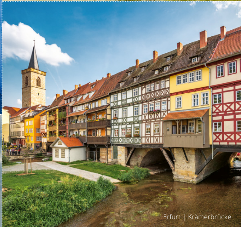
Erfurt | Krämerbrücke