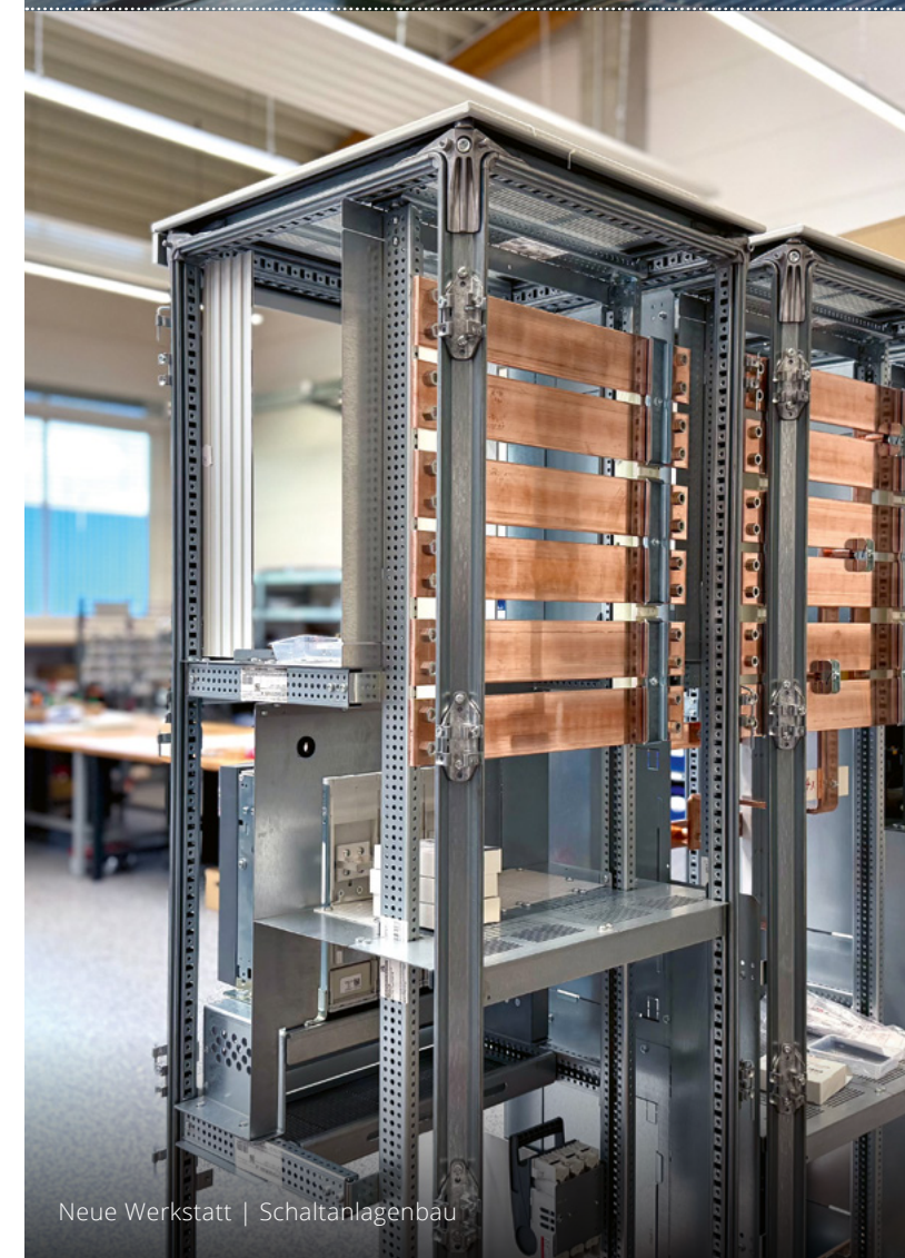
Neue Werkstatt | Schaltanlagenbau