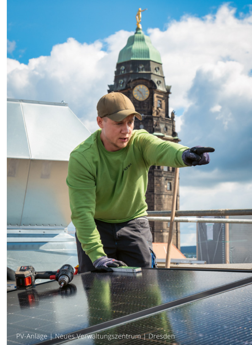
PV-Anlage | Neues Verwaltungszentrum | Dresden

Zum 1. August 2024 haben wir unseren Hauptsitz in Dresden um ein weiteres Gebäude in unmittelbarer Nähe erweitert. Das neue Gebäude auf der Heilbronner Str. 15 beheimatet zukünftig die Werkstatt für unseren Schaltanlagenbau sowie den Wareneingang und das Lager. Zum Ende des Jahres zählt die E.INFRA über 300 Mitarbeiter.