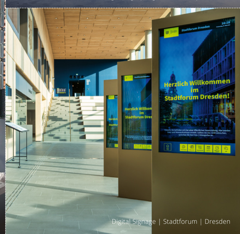
Digital Signage | Stadtforum | Dresden