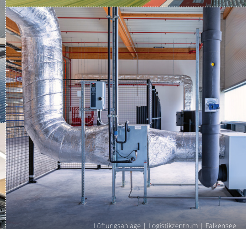
Lüftungsanlage | Logistikzentrum | Falkensee