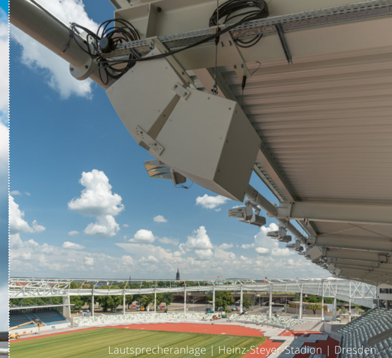
Lautsprecheranlage | Heinz-Steyer-Stadion | Dresden